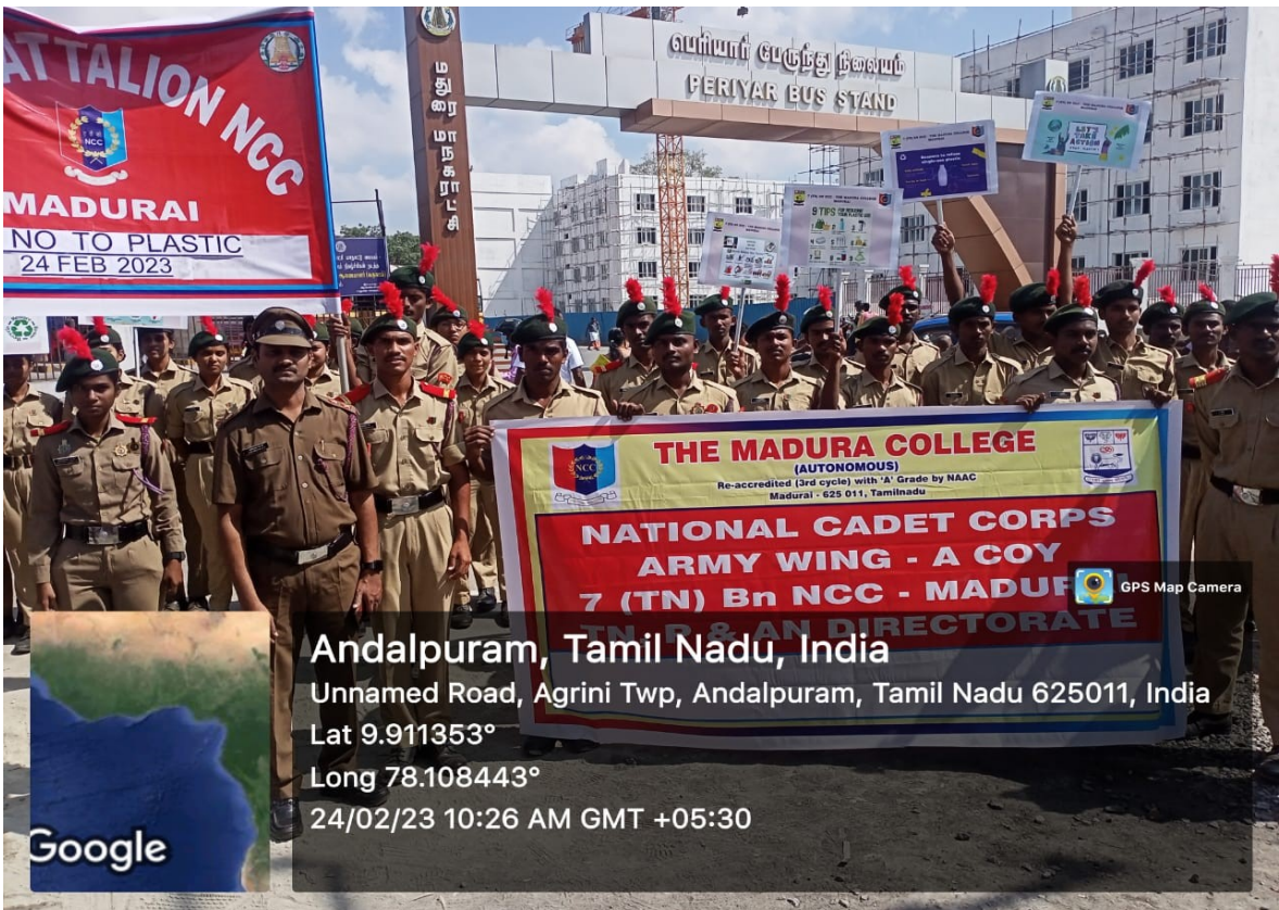
Awareness rally towards Periyar Bus stand

Andalpuram, Tamil Nadu, India Unnamed Road, Agrini Twp, Andalpuram, Tamil Nadu 625011, India Lat 9.911353° Long 78.108443° 24/02/23 10:14 AM GMT +05:30