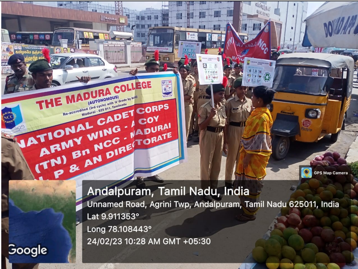
Spreading Awareness to public and vendors at shops in Periyar Bus stand