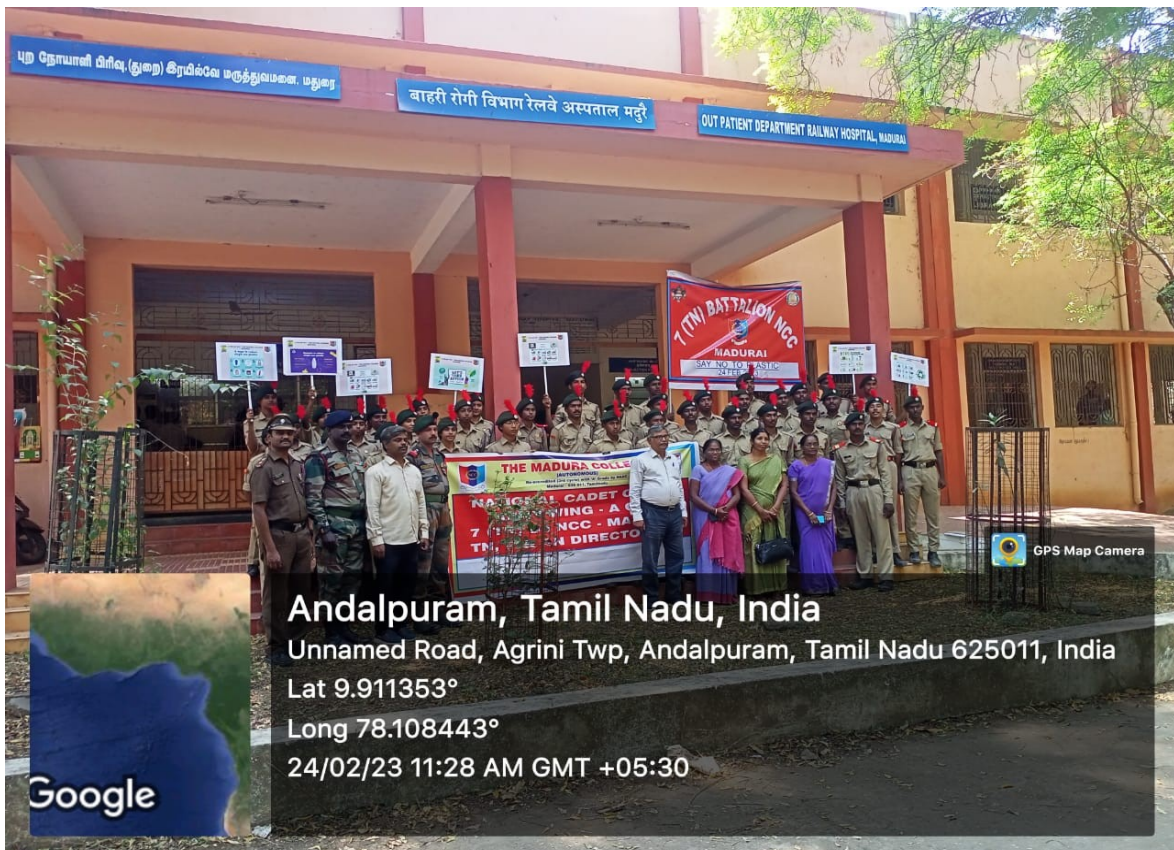
Doctors, Sanitation and Health Officials of Railway Hospital addressed the gathering