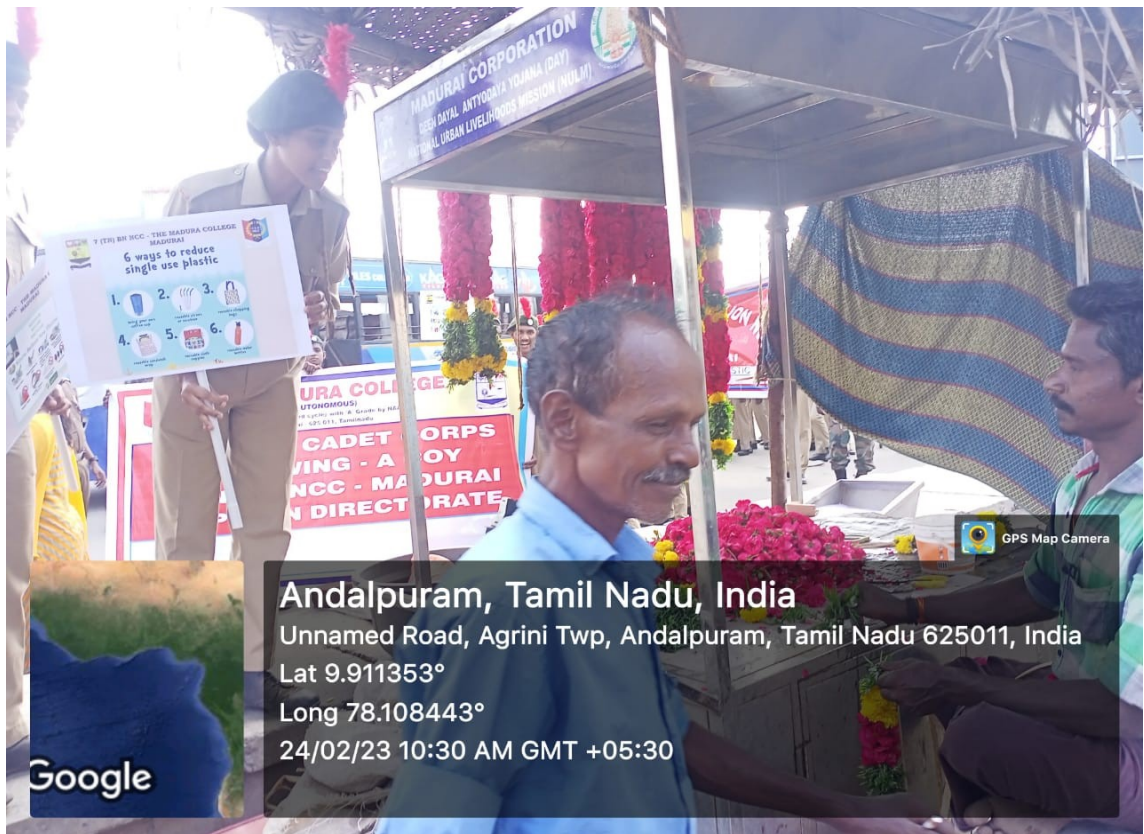
Spreading Awareness to public and vendors at shops in Periyar Bus stand