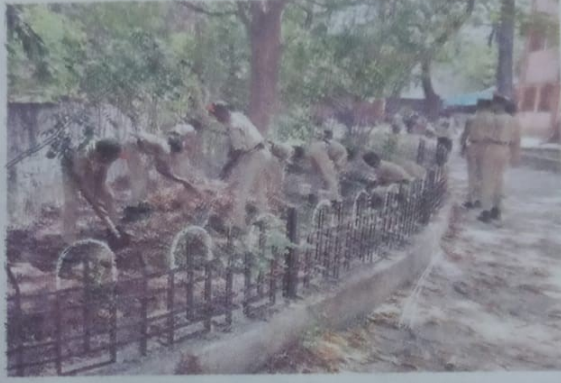
மதுரை ரயில்வே காலனியில் வெள்ளிக்கிழமை தூய்மைப் பணியில் ஈடுபட்ட தேசிய மாணவர் படையினர்.