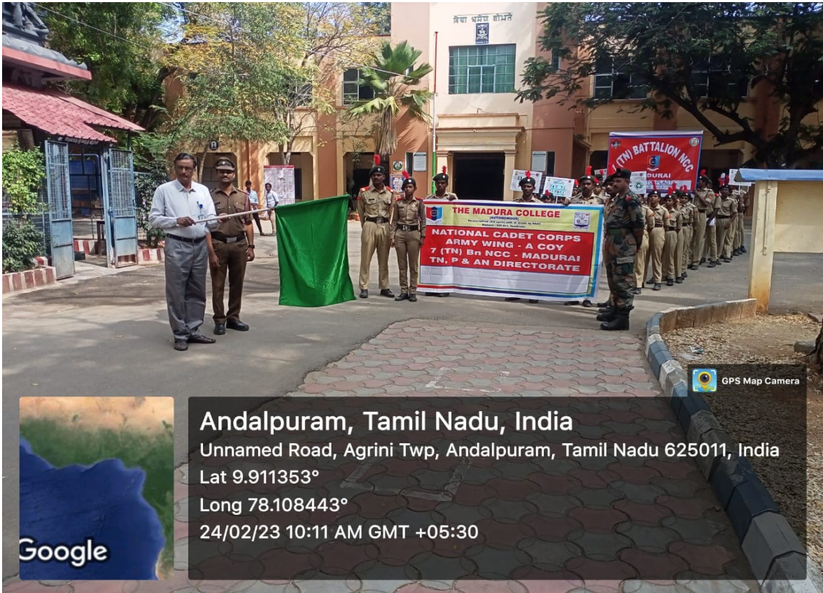
Treasurer of Madura College Board addressed the gathering and conveyed his wishes to the team

Andalpuram, Tamil Nadu, India Unnamed Road, Agrini Twp, Andalpuram, Tamil Nadu 625011, India Lat 9.911353° Long 78.108443° 24/02/23 10:09 AM GMT +05:30