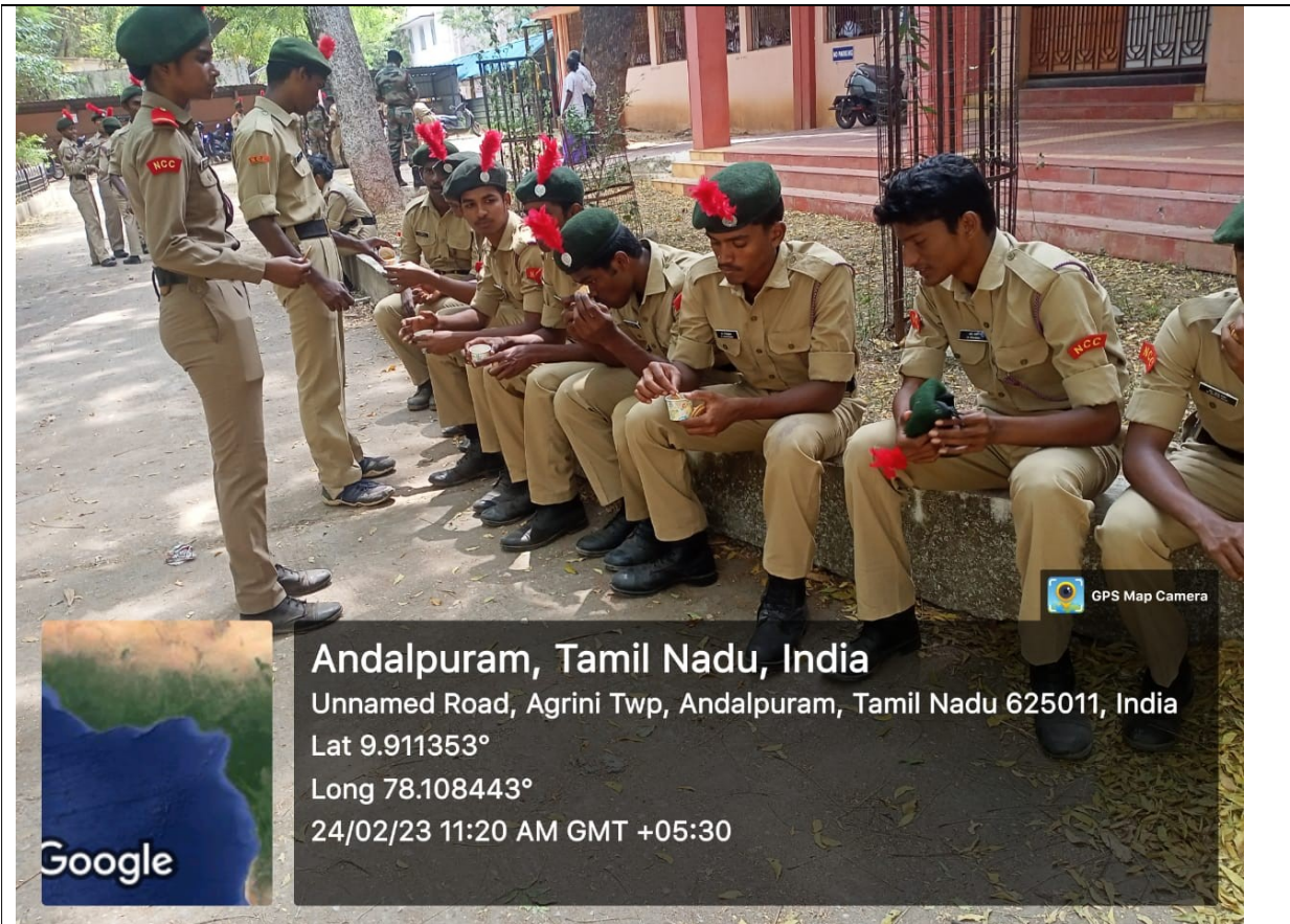
The team has reached Railway Hospital at Railway colony, Madurai